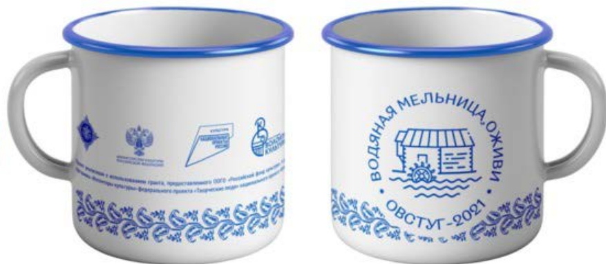
Кружка брендированная металл, эмаль, объем 400 мл, печать 1+1